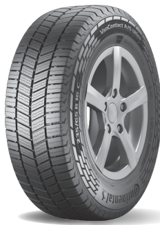
VanContact A/S Ultra