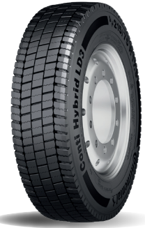
Conti Hybrid LD3