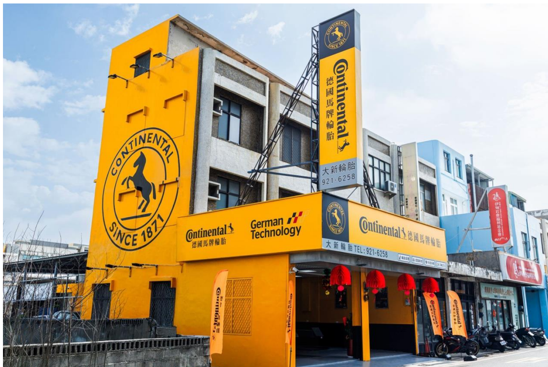
德國馬牌輪胎招牌店 - 大新輪胎提供多樣化選擇，皆能貼合澎湖車主的需求。

起初，店內僅規劃辦公室空間，但為了提升顧客體驗，特別增設客休空間與吧檯，打造更完善的服務環境，不僅提升了店內整體氛圍，也讓顧客能夠以更愉悅的心情進行愛車保養。這樣的規劃源自老闆對於服務細節的重視，希望改變離島地區「輪胎能用就好」的觀念，提升整體維修標準，讓車主擁有更安全與舒適的駕馭感受。